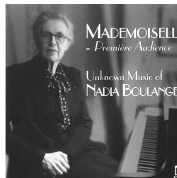
MADemoisELLE - Première Audience Unknown Music of NADIA BOULANGER